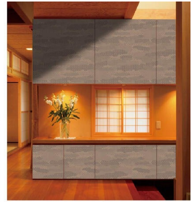
※イメージ 収納扉 TJ-10099K