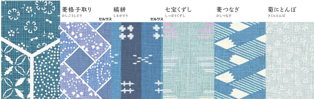
LJ-10100K 4x8のみ | TJ-10150K 4x8のみ | TJ-10078K 4x8のみ | LJ-10083K 4x8のみ | LJ-10088K 4x8のみ | LJ-10075K 4x8のみ

深みのある色合いが、伝統的な和柄の美しさを引き立てます。 旅館や料亭など、風格ある落ち着いた空間に良く合います。