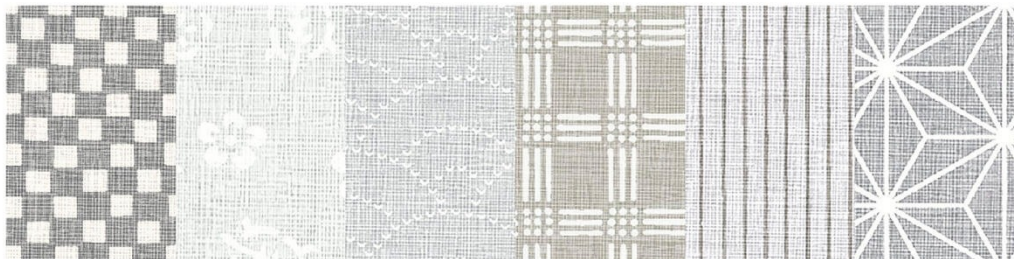
LJ-10104K 4x8のみ | LJ-10145K 4x8のみ | LJ-10137K 4x8のみ | LJ-10102K 4x8のみ | LJ-10138K 4x8のみ | LJ-10141K 4x8のみ