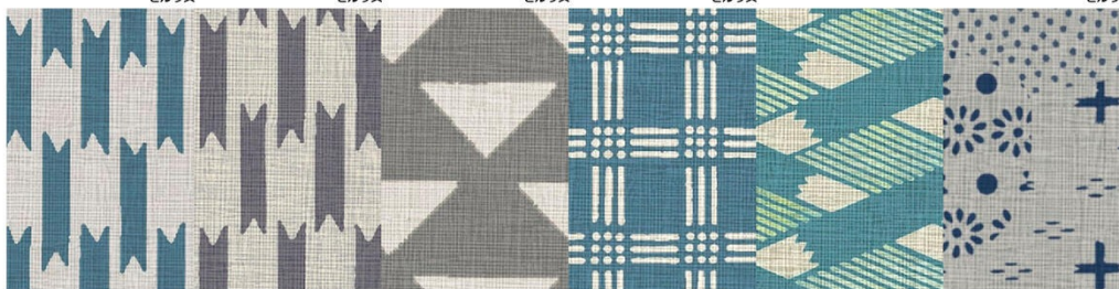
TJ-10096K 4x8のみ | TJ-10095K 4x8のみ | TJ-10107K 4x8のみ | TJ-10103K 4x8のみ | LJ-10087K 4x8のみ | TJ-10099K 4x8のみ