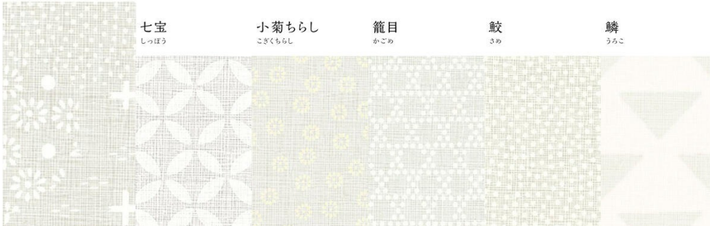
LJ-10098K 4x8のみ | LJ-10140K 4x8のみ | LJ-10070K 4x8のみ | LJ-10109K 4x8のみ | LJ-10110K 4x8のみ | LJ-10106K 4x8のみ

肌なじみの良いやわらかな色合いが、素朴で心地よい印象を与えます。 ラスティックな空間にも馴染む、どこか懐かしさを感じさせる柄です。