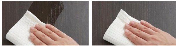
従来のメラミン化粧板